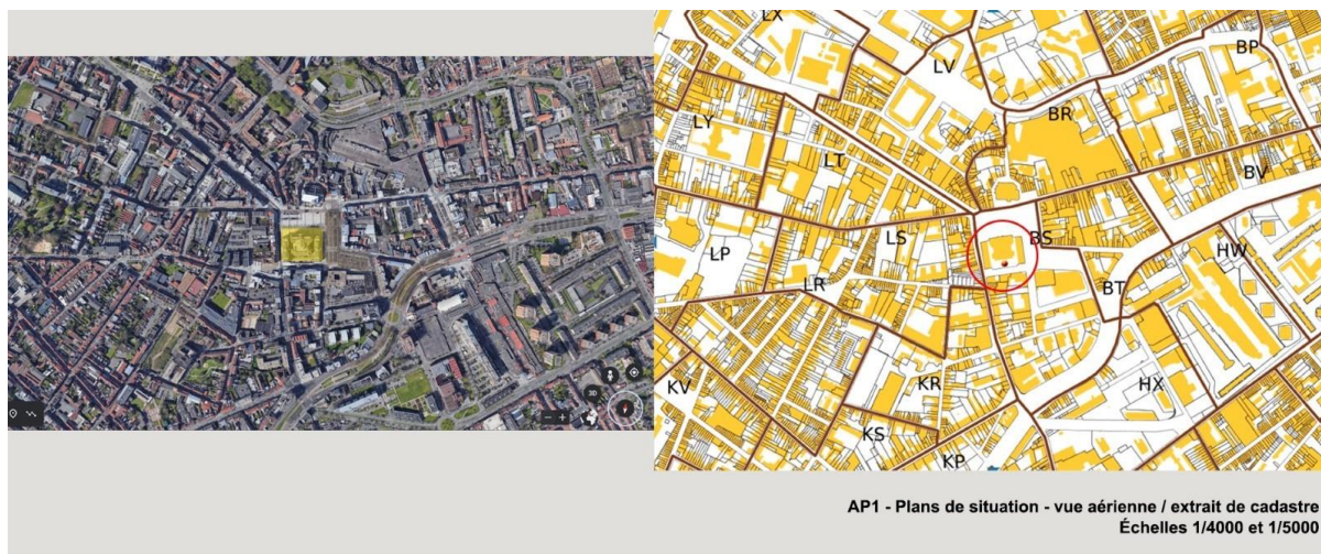
AP1 - Plans de situation - vue aérienne / extrait de cadastre Échelles 1/4000 et 1/5000

Par exemple, un plan de situation de l'Hôtel de Ville de Roubaix donnerait ce résultat :